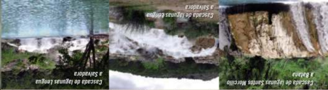
Cascada de lagunas Lengua a Salvadora