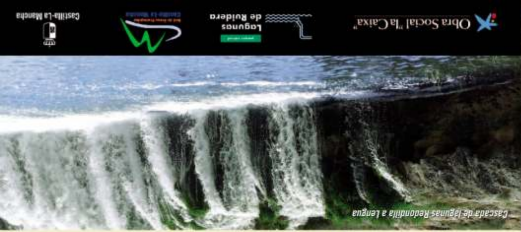
Cascada de lagunas Redondilla a Lengua